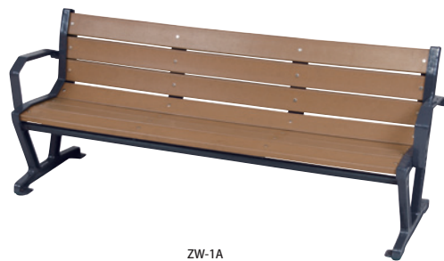
ZW-1A JAN 096277