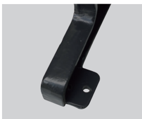
脚にアンカーボルト用の穴が設けてあります。 穴径：φ12mm