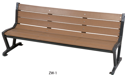
ZW-1 JAN 096260